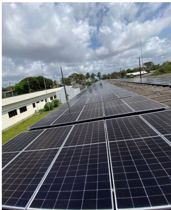
Figura 4 – instalação de usina fotovoltaica em edificação do HARF, viabilizando redução no consumo de energia elétrica do complexo HARF-OARF.