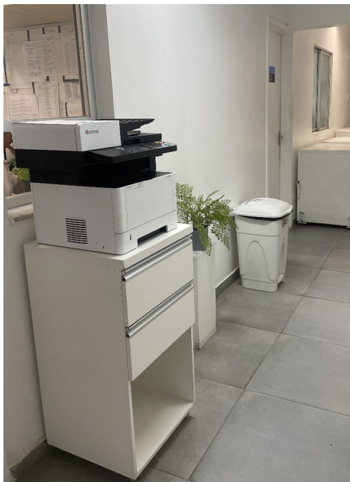
Figura 3 – impressora central para uso do efetivo em geral, com acesso por código individual, permitindo monitoramento de indicadores.