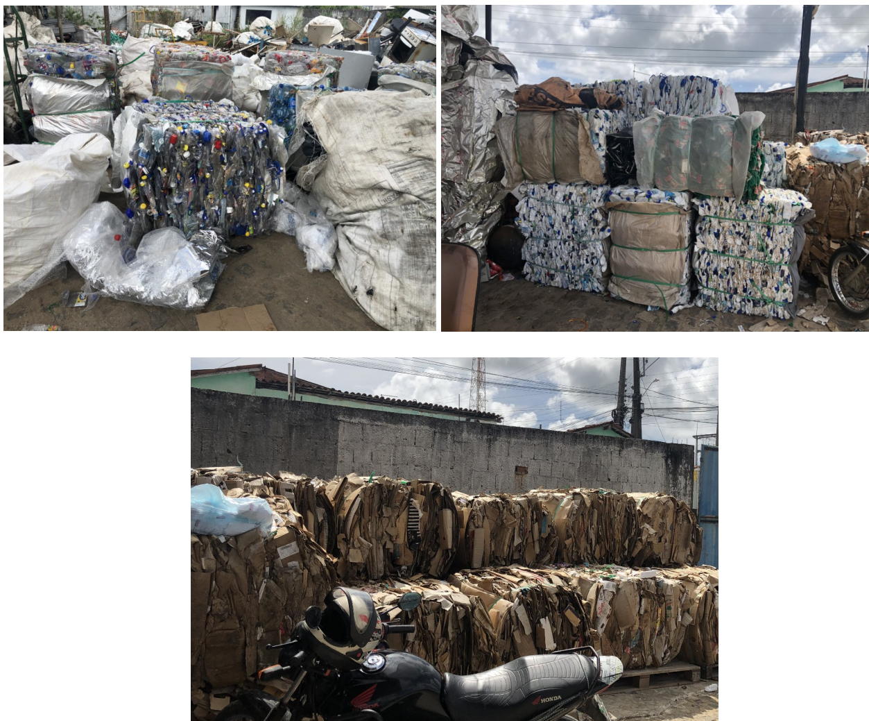
Figura 1 – materiais recicláveis separados na OM e destinados à cooperativa local.