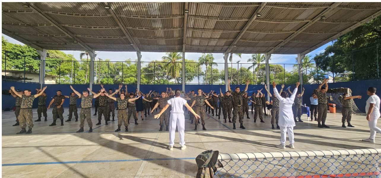
Figura 5 – atividade do programa “Acolhendo o acolhedor”, promovendo o incentivo à prática de atividade física ao efetivo.